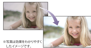
*写真は効果をわかりやすくしたイメージです。

東芝独自のアルゴリズムを採用し、写真や動画を、色補正や輪郭を強調して、より自然で美しい画質に変換。写真も質感や輝きを実物に近づけて再現できるので、昔撮った写真もキレイにして楽しめます。