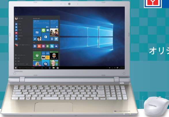
*画面はハメコミ合成です。*画面は実際のイメージと異なる場合があります。Windowsストアアプリは別売です。ご利用になれるアプリは、国・地域によって異なる場合があります。