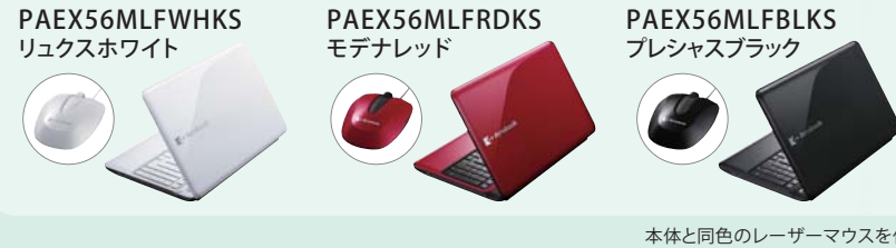
本体と同色のレーザーマウスを付属