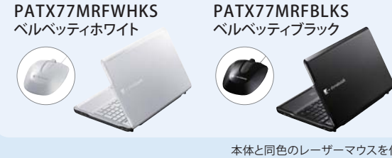
本体と同色のレーザーマウスを付属