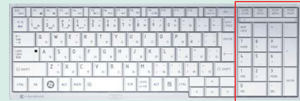
縦4列のキー配列で数字入力がより快適に行えるフルサイズテンキー付き。

ツヤのあるボディにマッチしたグロッシーなキーボードを採用。高級感あふれるトータルな質感は、オリジナルモデル限定仕様です。