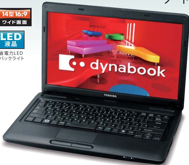
※画面はハメコミ合成です。