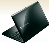
プレシャスブラック