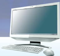
リュクスホワイト