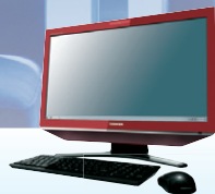
シャイニーレッド