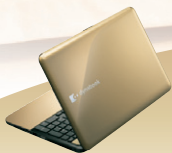
シャンパンゴールド