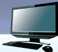
プレシャスブラック