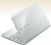
リュクスホワイト