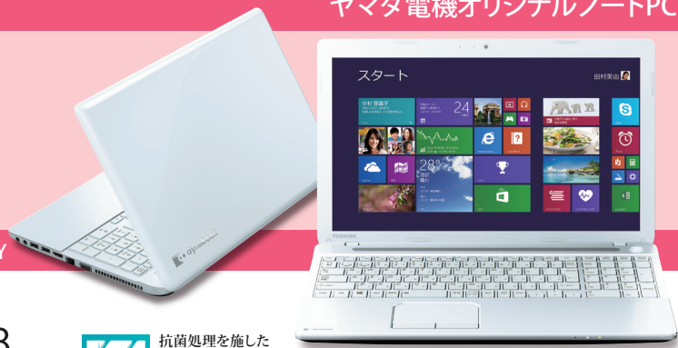
※画面はハモミ合成です。