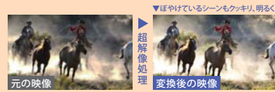
※写真は効果をわかりやすくしたイメージです。

超解像技術「レゾリューションプラス」は、東芝独自のアルゴリズムを 採用。映像をフレームごとく解析し、暗いシーンでは暗くならない ように色補正をしたり、輪郭の強調も暗いシーンと明るいシーンで 処理を変えて行うなど、より自然でキレイな高画質化を実現します。