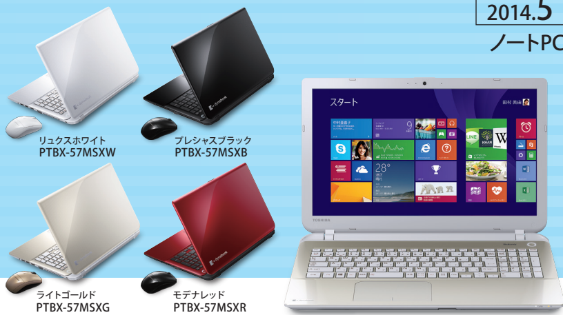
リュクスホワイト PTBX-57MSXW