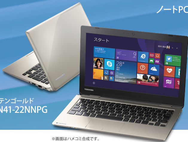
※画面はハメコみ合成です。