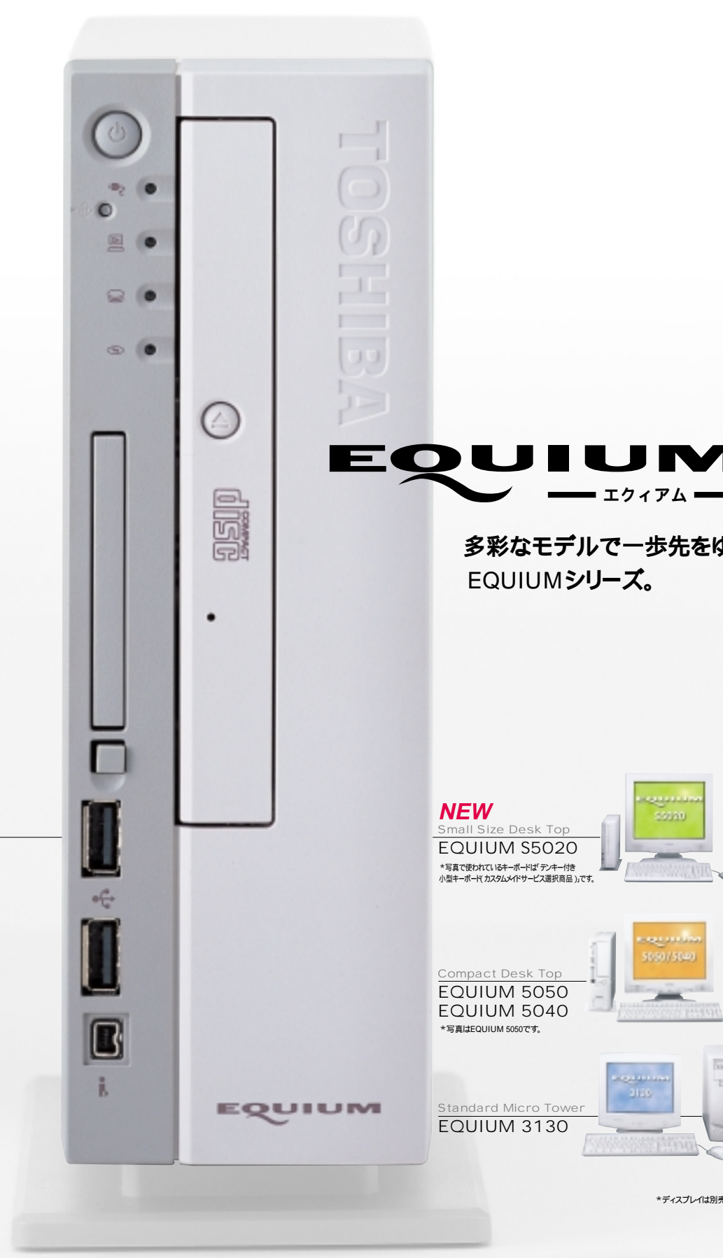
正面 原寸大 EQUIUM S5020