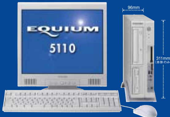
* ディスプレイは別売です。