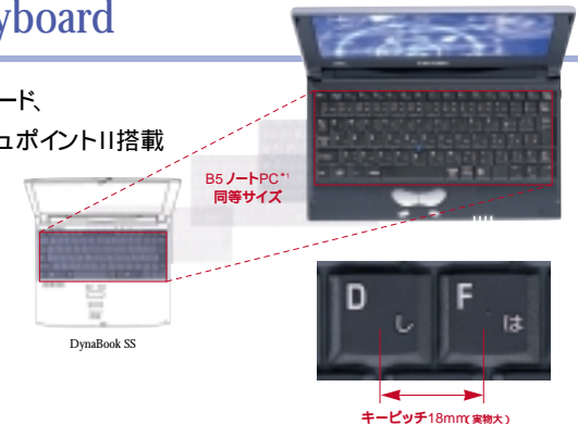
キーピッチ18mm(実物大)