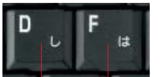
キーピッチ18mm(実物大)