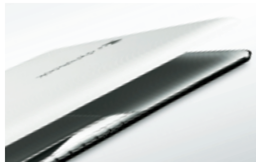
薄く軽く澄みわたるシェイプ。美しいカラーリング