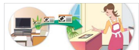
リビングのレグザブルーレイ／レグザサーバー *3 ▶ キッチンレグザタブレット

レグザブルーレイ／レグザサーバー *3 で受信している放送中のテレビ番組をライブ配信して、レグザタブレットで視聴できます。また、視聴中の番組に関するTwitterのタイムラインを見たり、ツイートも可能です。