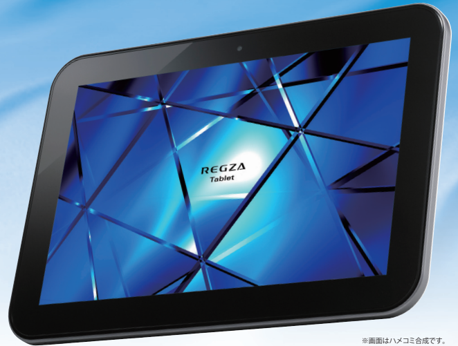
※画面はハメコみ合成です。