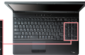
109キー (テンキー付き)