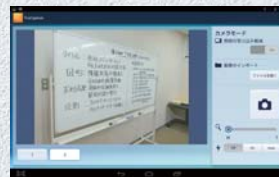
ホワイトボードを撮影

ホワイトボードに書かれた内容や手持ち資料を「TruCapture」で撮影してデータ化(PDF、JPEG)でき、「TruNote」や「シンクフリーモバイルオフィス*」に取り込んで、手書きコメントを追加することもできます。また、台形補正や白とび補正も可能です。