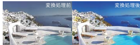
※写真は効果をわかりやすくしたイメージです。

①鮮鋭感を上げてより美しく「レゾリューションプラス*1」ソフトウェア上で鮮鋭感をアップする、東芝ならではの「レゾリューションプラス」機能により、さまざまな映像をより美しい画質で描き出します。