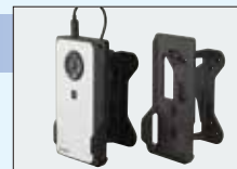
●VESAマウントキット (型番:PA5296U-1GVM)オープン価格 ※6 DE100とポート拡張アダプタUSB Type-C ™ (オプション) ※7 をディスプレイの背面に取り付けると、DE100が省スペースデスクトップPCに。