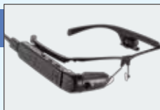
●インテリジェントビューアAR100キット (型番:PA5293N-1GLS)オープン価格 ※5

高画質カメラ、高精細ディスプレイ、スピーカー、タッチパッド等を搭載しながら、本体質量約48gの軽量設計により、ストレスのない掛け心地を実現するメガネ型ウェアラブルデバイス。遠隔支援機能 ※3 に対応したアプリケーションで、作業現場での業務効率を高めることができます。