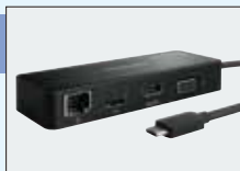
●ポート拡張アダプタ USB Type-C ™ ※7 (型番:PAUAD001)オープン価格 ※6 HDMI ® 4K出力 ※4 など、ビジネスに必要なインターフェースを拡張可能。