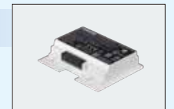
●バッテリーパック 21AW (型番:PA5289N-1BR5)オープン価格 ※6 ●バッテリーチャージャー (型番:PA5303N-1GHG)オープン価格 ※6 交換可能なバッテリーパックを4つ同時に充電可能。