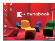
③ 仮想デスクトップ