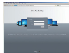
① サーバーにログイン