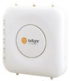
センサー SS-300-AT-C-60 高性能モデル、大規模向け