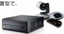
機器の操作に不慣れな方も迷わず操作できる簡単リモコンと、カメラやマイクスピーカーをパッケージに。

低コストで導入できる拡張性の高いテレビ会議システムです。リモコンで操作ができる会議室設置型で、一般的なテレビ会議システムより遙かに安く、同等以上の高画質・高音質を実現。PCやスマートフォン・タブレットとも接続が可能で、さらには国際間でも安定した接続を実現します。