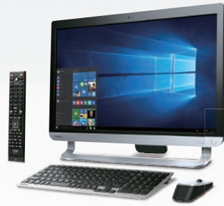
プレシャスブラック PD71TBS-BWA3 ■ リモコン付属 D71