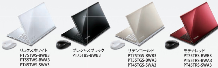
リュクスホワイト PT75TWS-BWB3 PT55TWS-BWA3 PT45TWS-SWA3