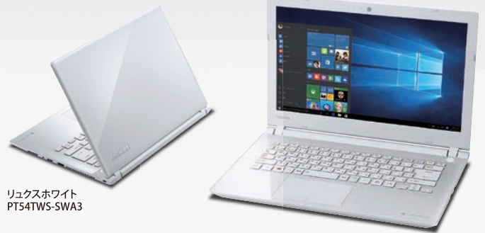
リュクスホワイト PT54TWS-SWA3