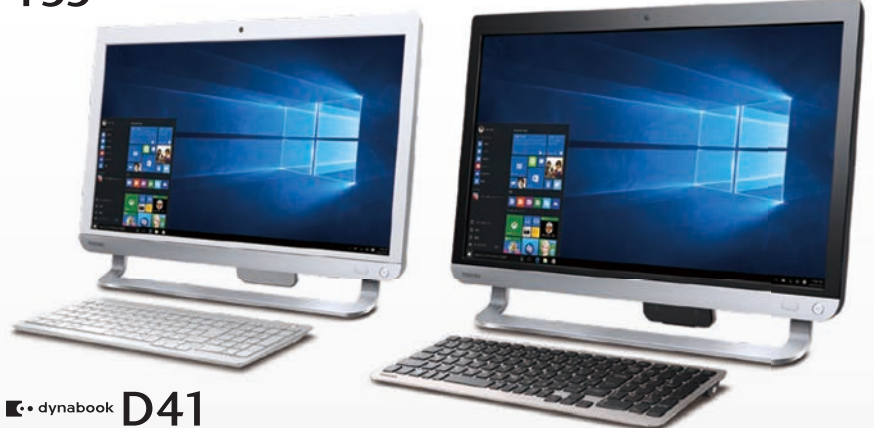
◆ dynabook D41