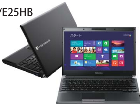
※画面はハメコミ合成です。