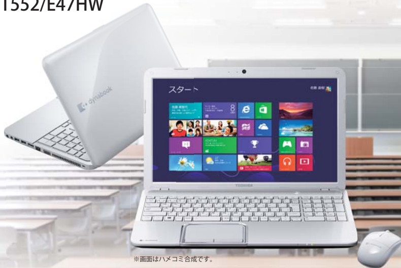
※画面はハメコミ合成です。