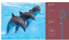
▲ビデオライブラリ画面(TOSHIBA Media Player by sMedio TrueLink+) 動画を高画質化するには、設定画面のオフ ボタンを切り替えるだけの簡単さ。

※DVDを再生する場合は「TOSHIBA VIDEO PLAYER」、動画(WMV方式)を再生する場合は「Windows Media® Player」、 映像・写真ファイルを再生する場合は「TOSHIBA Media Player by sMedio TrueLink+」を使用した場合に有効です。