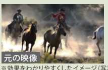
※効果をわかりやすくしたイメージ(写真)です。

「レゾリューションプラス」で、くっきり鮮やかに高画質化 超解像技術(レゾリューションプラス)は、東芝独自のアルゴリズムを 採用。映像をフレームごとに解析し、暗いシーンでは暗くなりすぎない ように色補正をしたり、輪郭の強調も暗いシーンと明るいシーンで 処理を変えて行うなど、より自然でキレイな高画質化を実現します。