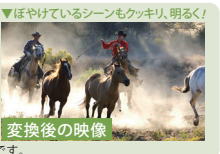
▼ぼやけているシーンもくっきり、明るく!