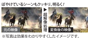
※写真は効果をわかりやすくしたイメージです。

超解像技術(レゾリューションプラス)は、東芝独自のアルゴリズムを採用。映像をフレームごとに解析し、暗いシーンでは暗くなりすぎないように色補正をしたり、輪郭の強調も暗いシーンと明るいシーンで処理を変えて行うなど、より自然でキレイな高画質を実現します。