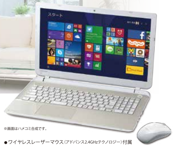
※画面はハメコミ合致です。