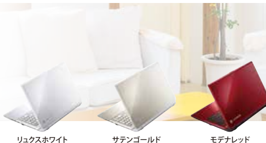
リュクスホワイト サテンゴールド モテナレッド