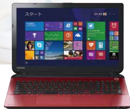
※画面はハメコみ合です。