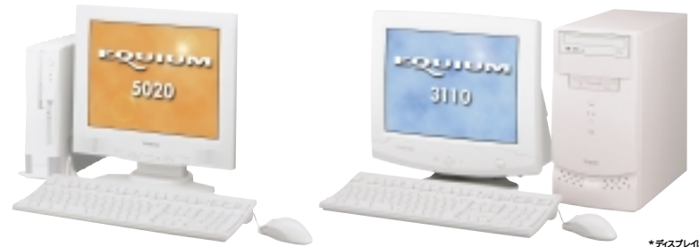
*ディスプレイは別売です。