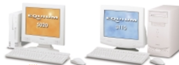
EQUIUM 5020 Intel® Pentium® 800EBMHz/ Intel® Celeron™ 667MHz