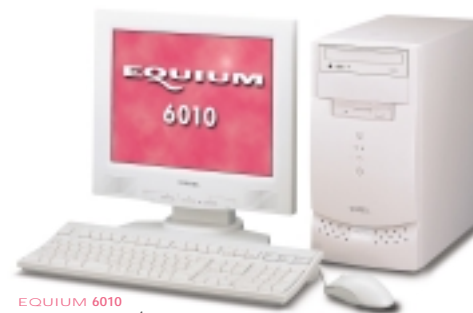
EQUIUM 6010 Intel® Pentium® 1GHz