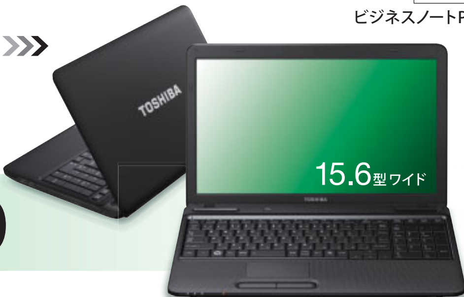
※画面はハメコミ合成です。

PB350BEBNR2A31 PB350BFBNR2A31 オープン価格 ※オープン価格の製品は標準価格を定めておりません。