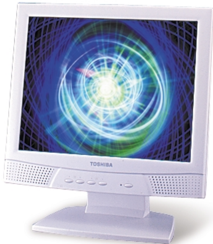
15型フラットパネルディスプレイK(型番:PVLCD15K)標準価格 128,000円(税別)

市販のVESA規格対応の壁掛け用固定器具などに対応。ディスプレイ部分をアームやブラケットなど、同規格のディスプレイ固定金具に取り付けて机の上を広く使用できます。