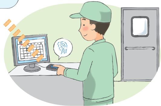
PCを持たない従業員のために