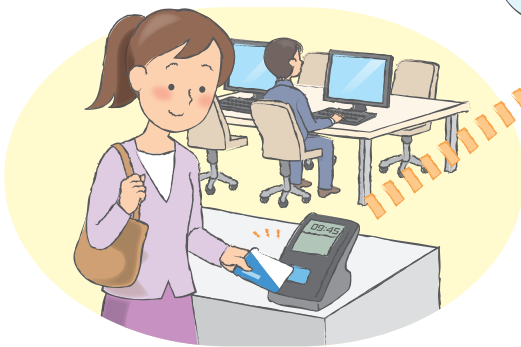
サテライトオフィスで